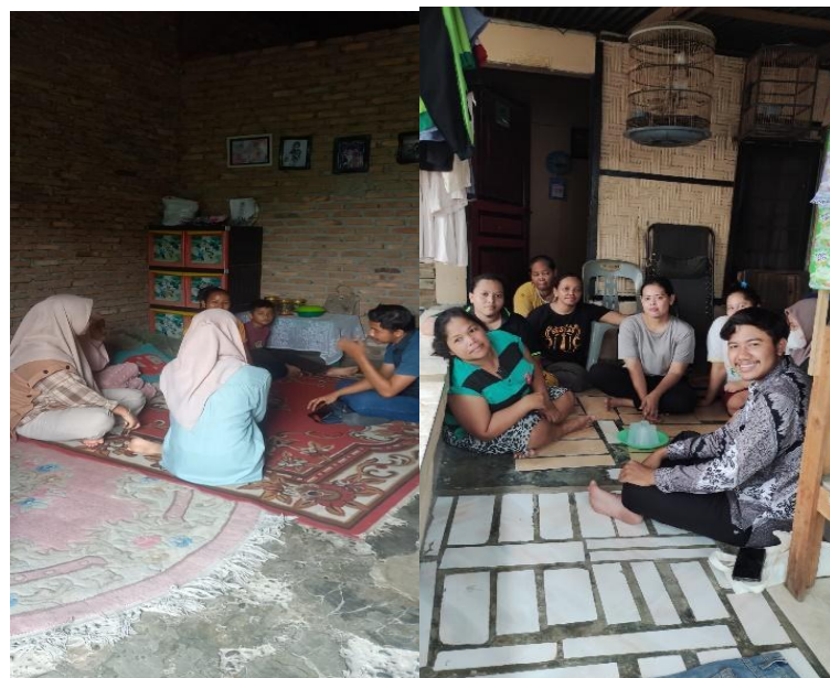
Gambar 5. Kunjungan Bidang Advokasi Kerumah Masyarakat