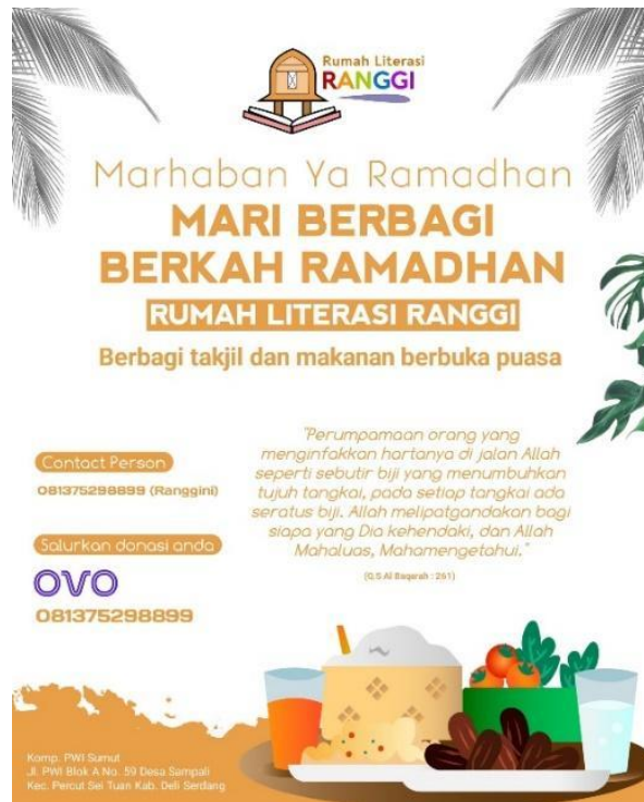
Gambar 4. Flayer Donasi Berbagi Takjil Kepada Anak Rumah Literasi Ranggi