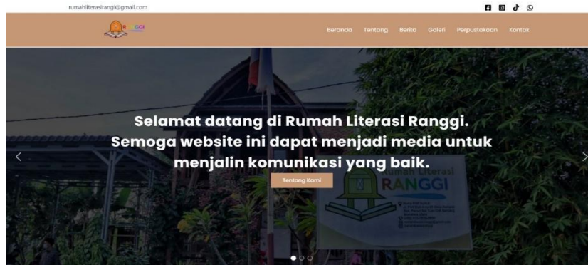
Gambar 7. Website Rumah Literasi Ranggi